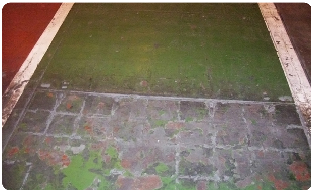
Oberseite der alten BetonStahl-Abdeckung

In diesem Fall wurden Abdeckungen benötigt, welche den bestehenden, farbigen Untergrund ergänzen.