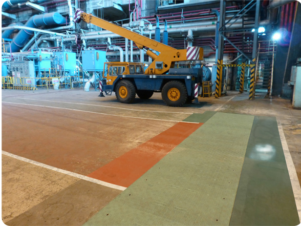
Faserverbundabdeckungen in D400

Im zweiten Bauabschnitt wurden die zu belegenden 7,65 m mit 1.350mm langen Faserverbundabdeckungen in Belastungsklasse D 400 ausgestattet. Die Abdeckungen liegen jetzt im Eingangsbereich des Heizraums, in den regelmäßig LKW's durch die Rolltore ein- und ausfahren.