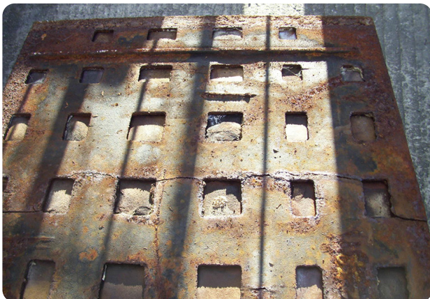
Unterseite der alten BetonStahl-Abdeckung