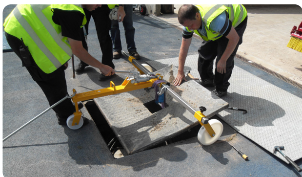
Manipulation manuelle : l'installation précédente requérait un poussoir hydraulique pour déplacer le tampon