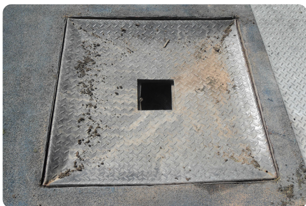
Finis avec le vieux : les tampons en acier endommagés vont être remplacés par les trappes d'accès Fibrelite

Fibrelite a récemment installé des trappes d'accès dans le stade afin de remplacer les trappes existantes en acier. Ces plaques étaient très endommagées par le passage fréquent de véhicules lourds, notamment pour les concerts. L'équipe de maintenance du stade voulait également résoudre le problème de la difficile et dangereuse manutention du fait du poids des plaques en acier préalablement installées.