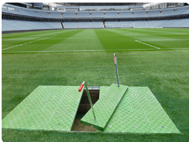
Grande envergure : les trappes d'accès Fibrelite peuvent se décliner jusqu'à 1600 mm avec une capacité de charge de 40 tonnes.

La phase 2 de la poursuite des travaux au stade du leader de Premier League est maintenant terminée. Les trappes d'accès ont été installées pour les fosses existantes et les nouvelles fosses à camera afin de résoudre le problème de la manipulation lourde des tampons en acier préalablement installés.