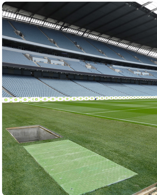
Disponible dans tous les coloris RAL, Fibrelite peut répondre à toutes les exigences de couleurs que vous pouvez avoir.

Pour plus d'informations sur la gamme des produits Fibrelite, n'hésitez pas à nous contacter: