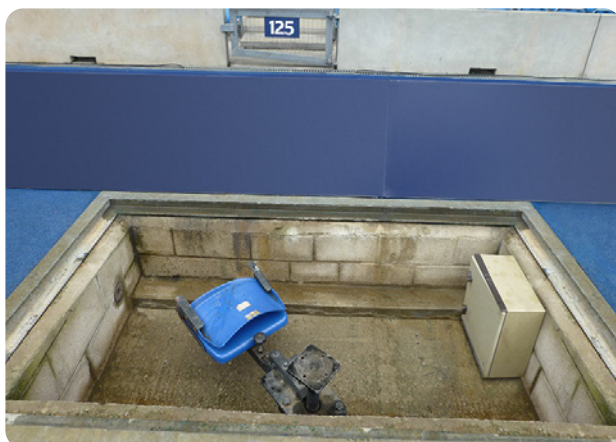
Une fosse a camera existante prête à être couverte par les trappes d'accès en composite Fibrelite.

Une des principales conditions du client était que les trappes d'accès Fibrelite devaient se fondre dans l'environnement. Pour cela, Fibrelite propose de fournir à ses clients des tampons pouvant se décliner sous plusieurs coloris. En effet, le pigment de couleur est introduit directement dans la résine durant le processus de moulage en veillant à ce que le colorant soit appliqué non seulement à la surface, mais également imprégné sur tout le tampon. Ainsi, aucune maintenance du tampon n'est requise après l'installation. D'avantage de personnalisation du tampon peut être fournie sous la forme d'un logo, rendant les trappes d'accès Fibrelite vraiment polyvalente.