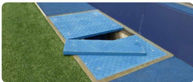
Les trappes d'accès Fibrelite possèdent une surface antidérapante