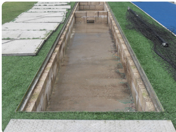
Une nouvelle fosse à camera prête à être recouverte par les trappes d'accès Fibrelite.