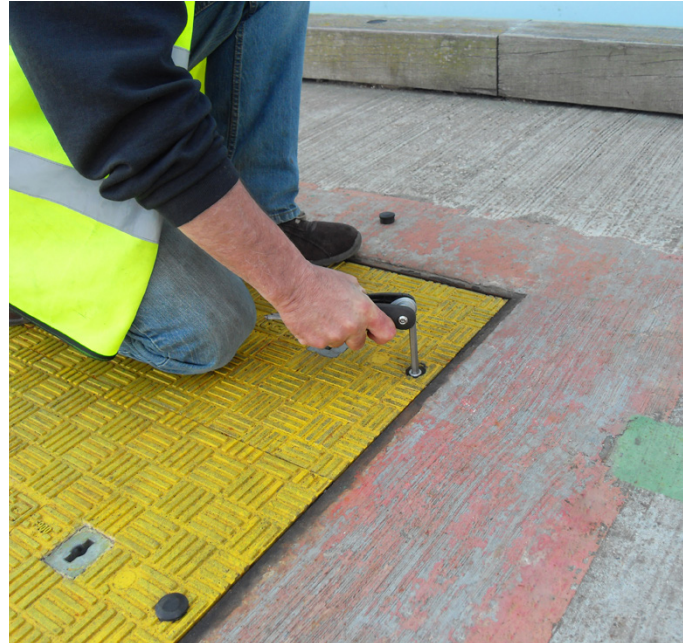
מפעיל מסיר את מערכת האבטחה של Fibrelite.