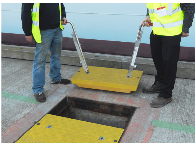
הסרה פשוטה ובטוחה באמצעות ידיות הרמה של Fibrelite

מכסי השוחה של Fibrelite תוכננו כדי להתאים ישירות למסגרת הקיימת, מה שמייצר את עלות ההסרה ומפחית את עלויות ההתקנה באופן ניכר. מכסי השוחה החלופיים ניתנים להחלפה קלה ובטוחה באמצעות ידיות הרמה של Fibrelite (FL7).