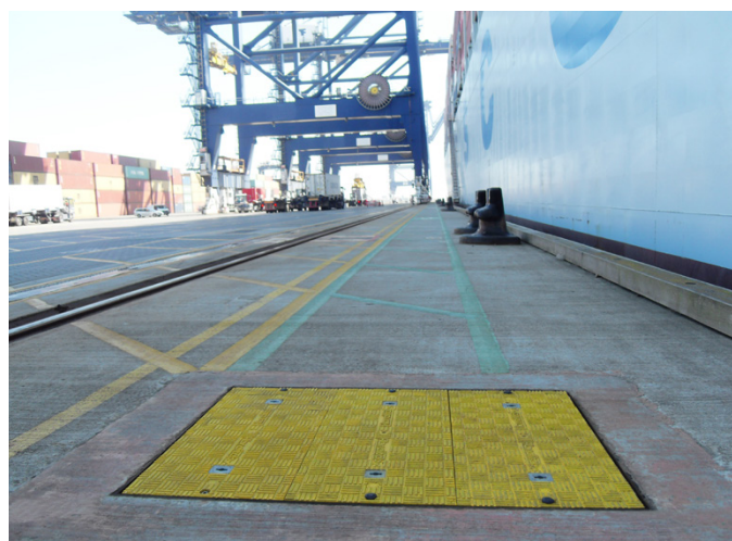
מכסי שוחה קלים בעומס של 90 טון של Fibrelite מותקנים בקרבת המזח

מכסי השוחה של Fibrelite תוכננו כדי להתאים ישירות למסגרת הקיימת, מה שמייצר את עלות ההסרה ומפחית את עלויות ההתקנה באופן ניכר. מכסי השוחה החלופיים ניתנים להחלפה קלה ובטוחה באמצעות ידיות הרמה של Fibrelite (FL7).