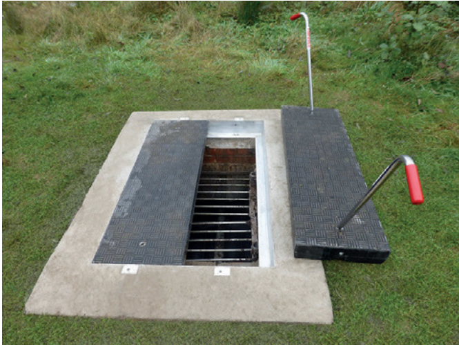
Bezobsługowe i niezmechanizowane części: Fibrelite FM45 panele do wykopów