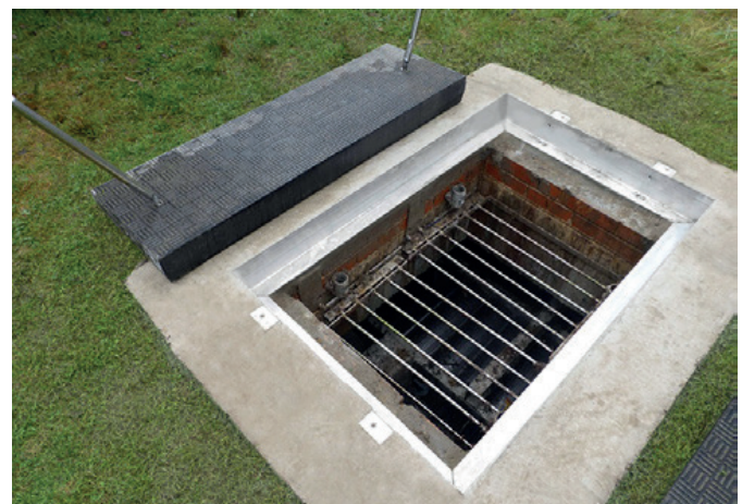
Bezpieczny i łatwy ręczny demontaż: Pokrywy Fibrelite FM45 są przenoszone ręcznie

Bez konieczności montowania zawiasów i części mechanicznych nie ma możliwości awarii i potrzeby przeprowadzania konserwacji – Fibrelite ma produkt FM45 „zamontuj i zapomnij”. Co więcej, waga pokryw do wykopów Fibrelite- nie przekraczająca 25 kg spełnia wszystkie wymogi w zakresie zdrowia i bezpieczeństwa pracowników. Mark Corbett trener w dziedzinie bezpieczeństwa w West Waste Water powiedział: „Używanie tych pokryw eliminuje problem, związany z obsługą jak i obrażeniami pracowników, końce uchwytów znajdują się na wysokości pasa eliminują konieczność schylania się. Poza tym pokrywy nie blokują się więc nie ma potrzeby używania dodatkowych narzędzi celem ich uwolnienia.