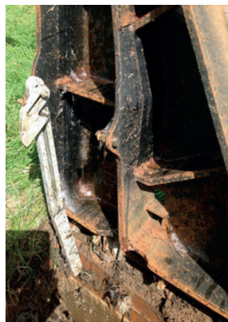
Zawodzące, ciężkie, metalowe pokrywy do podziemnych przewodów gazowych oraz mechaniczne podpory sprężynowe stanowią poważne ryzyko urazów przy pracy.