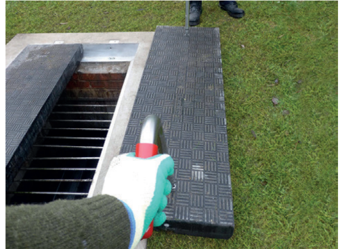
Specjalnie zaprojektowany uchwyt Fibrelite