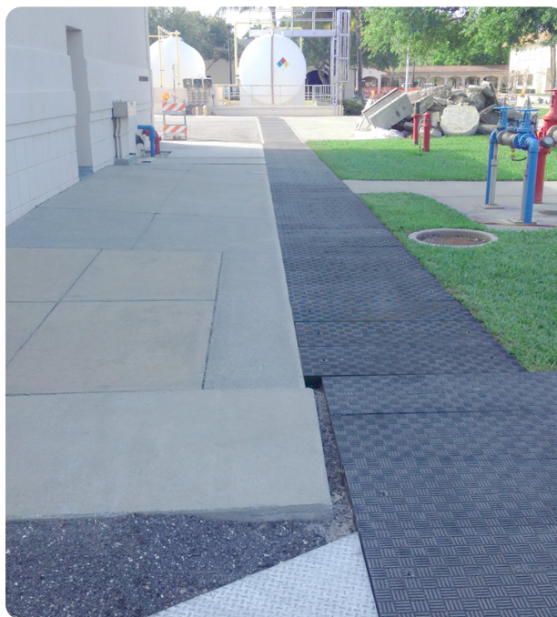
Alternative parfaite au béton

Les tampons en béton traditionnels sont dangereux à manipuler et nécessitent une main d'œuvre importante pour les déplacer.