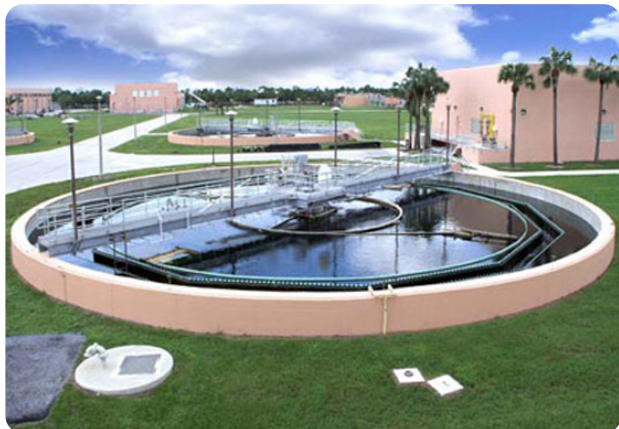
Du béton au matériau composite

Du béton au composite : Une station d'épuration basée en Floride se tourne vers la solution Fibrelite pour ses trappes d'accès