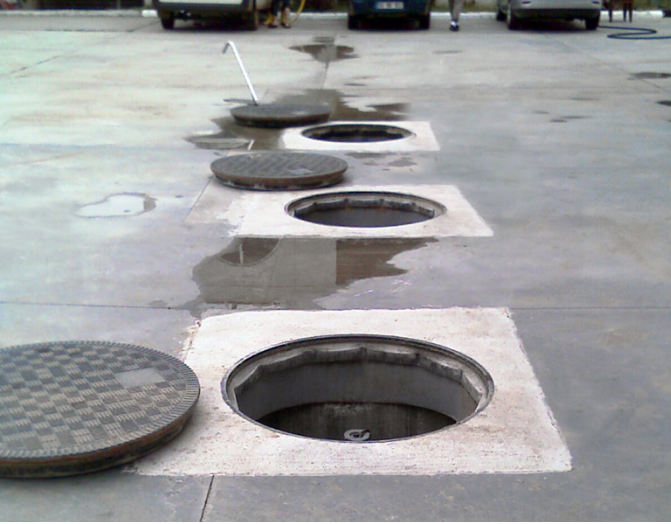
Fibrelite'in su sızdırmaz CTP menhol kapakları İstanbul'da ve çevre bölgede benzin istasyonlarında kullanılmaktadır

Fibrelite, Tora Petrol firmasına tam su sızdırmaz CTP kompozit menhol kapaklar sunuyor, bunlar Türkiye, Marmara bölgesindeki yakıt tanklarının korunmasını sağlayacaklar. Bu kapaklar 2017 Temmuz ayında meydana gelen su baskınlarında çok değerli olduklarını kanıtladılar, Fibrelite'in kompozit menhol kapakları yüzey suyunun girişini önleyerek yakıt tanklarında hasarı en aza indirdiler. Türkiye'nin en büyük şehri olan İstanbul, Marmara bölgesinde yer almaktadır.