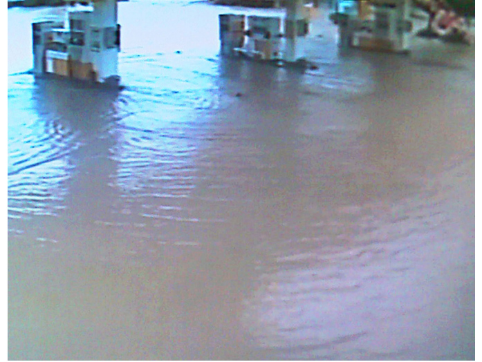
İstanbul'da bulunan bazı benzin istasyonları Temmuz 2017 tarihinde su baskınına uğradılar