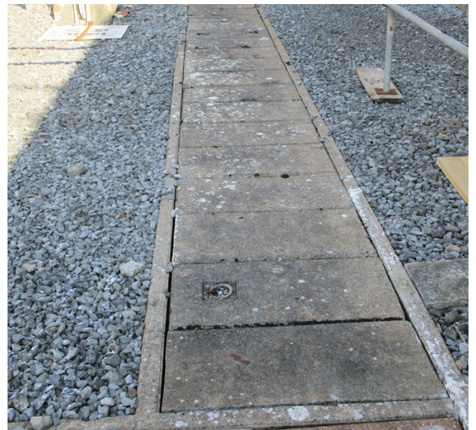
Mis en place de zone de restriction d'accès pour éviter le risque d'accident lié au passage de charges lourdes pendant le démantèlement