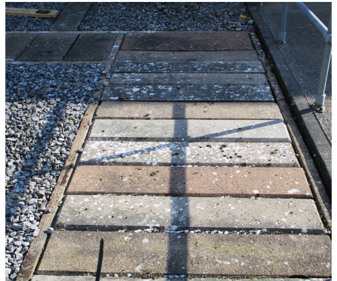
Les couvertures béton installées présentaient des prémices de délabrements

La taille et la complexité de ce projet ont amené à une conception qui se devait d'être très flexible.