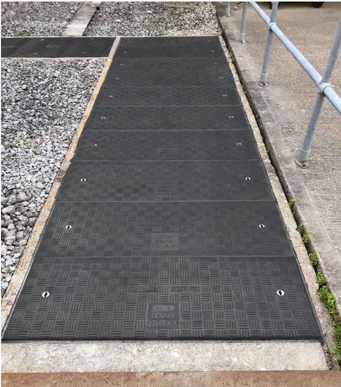
Les couvertures Fibrelite sont inaltérables et présentent une surface anti-dérapante