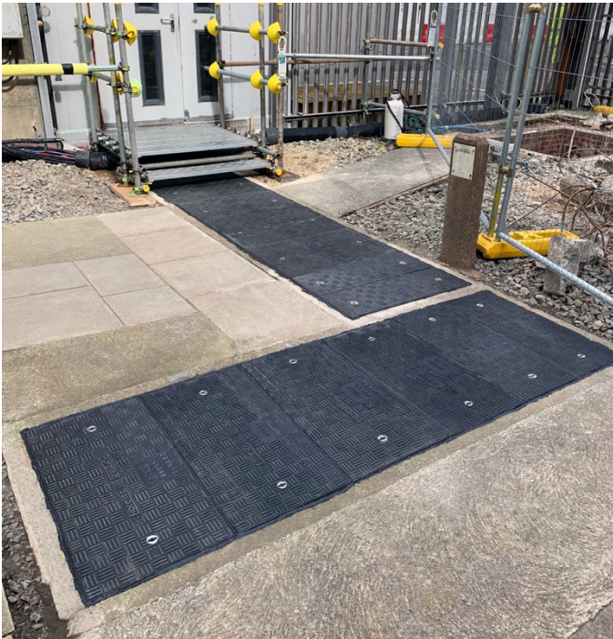
Remplacement des couvertures de tranchées par des tampons en fibre sur mesure conçus et réalisés par Fibrelite sur le site de Hinkley Point (A) centrale nucléaire, en cours de démantèlement